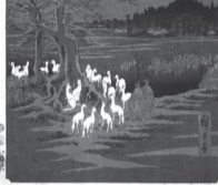
写真：歌川広重「名所江戸百景 王子装束の木大晦日の狐火」(北區飛鳥山博物館所蔵)

狐メイクや狐面をつけた人々で賑わう大晦日の王子。油断をしていると、本物の狐につままれるかもしれませんね。