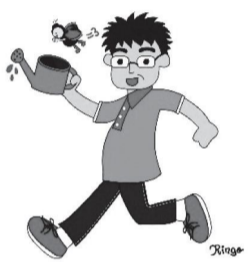
いきいきサポーター イメージキャラクター いきいきさん

対 区内在住で北區高齢者いきいきサポーター制度に関心のある方 日 3月1日(木) 午後1時～3時30分 場 北とびあ15階ペガサスホール 内 ボランティア活動の時間に応じて交付金を受け取れる制度の受入施設担当者による活動相談会や菓子販売、健康チェック無料体験等を実施します。 申 当日、直接会場へ 問 NPO法人東京都北區市民活動推進機構(北區NPO・ボランティアぶらざい)(月曜、祝日休館) ☎(5390)1771