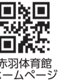
赤羽体育館ホームページ

申復はがき(記入例参照)で、4月3日(火)(当日消印有効)まで ※1通1レッスン 問場先〒115-0042 志茂3-46-16 赤羽体育館 ☎(3901)3140 HPhttp://akatai.net