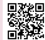
北区内田康夫ミステリー文学賞特設サイト

※受賞作品は、「webジェイ・ノベル」(実業之日本社)に掲載されます。なお、区長賞・奨励賞は、4月中旬予定です。