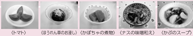
(トマト) (ほうれん草のお浸し) (かぼちゃの煮物) (ナスの味噌和え) (かぶのスープ)