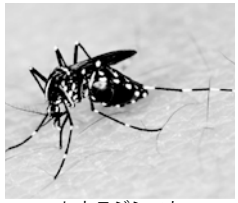
ヒトスジシマカ

区では、区道や区立公園など公共の雨水マスに幼虫の成長を抑える薬剤を散布し、発生総数を減らす対策を行っています。しかし、蚊は小さな水たまりでも、1週間ほど水がたまる場所であれば簡単に発生します。1週間に1度は、以下の発生源をチェックし、不要な水たまりはなくしましょう。また、なくせない水たまりは定期的に清掃や水の交換を行いましょう。一人ひとりの対策が蚊の発生予防につながります。