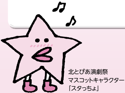
北とぴあ演劇祭 マスコットキャラクター「スタッチョ」

「みる」「でる」「つくる」をキーワードに、毎年秋に開催している市民の手づくり演劇祭。19年目を迎える今年は、過去最多34劇団の公演と、演劇を楽しむためのさまざまなワークショップや講座を開催!