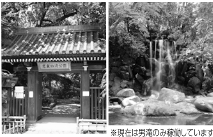
※現在は男滝のみ稼働しています

滝のそばでマイナスイオンをたっぷり浴びて、自然のクーラーのなかで涼をとるのはいかがですか。都会の喧騒を離れ、豊かな自然を満喫すれば、リフレッシュできること間違いありません。