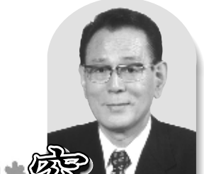
北区長 花川典悠太