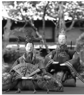
酒田市(本間家のお雛様)

【日】3月〜11月 午前9時〜午後5時 【場】群馬県吾妻郡中之条町大字折田2411 【問】中之条ガーデンズ ☎0279(75)7111