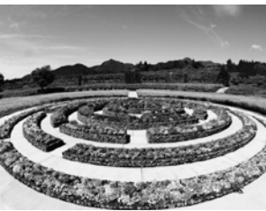
中之条町(中之条ガーデンズ)