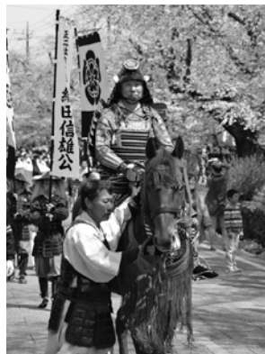
甘楽町・さくら祭り