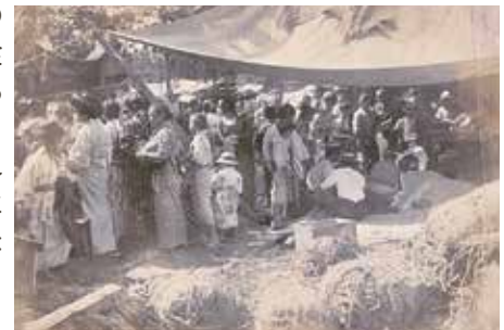
宝幢院境内での救援米配給の様子

渋沢邸のあった飛鳥山を訪れた際は、さまざまな震災復興に尽力した渋沢翁の姿を想像しながら散歩してみてください。