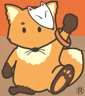
北区認知症支援キャラクター 「こんちゃん」