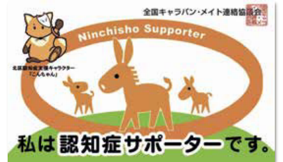
「認知症サポーターカード」