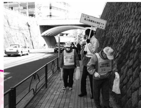
今年3月、田端駅周辺でキャンペーンを実施した際の様子