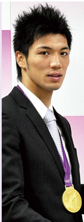
●村田 諒太 ロンドン五輪 ボクシング男子ミドル75kg級 金メダル 学校法人東洋大学職員

※東洋大学と北区は平成23年6月、連携協力に関する包括協定を締結し、さまざまな分野で連携している。