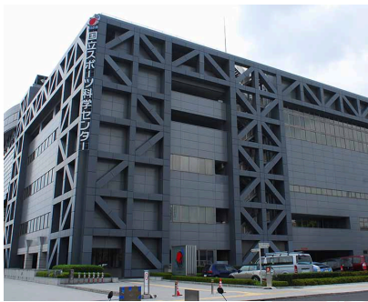
国立スポーツ科学センター(JISS)