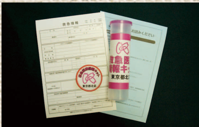
●救急医療情報キット・防災用ホイッスル配布(10月)