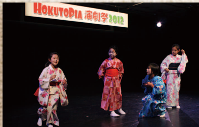
●北とびあ 演劇祭2012(9月)