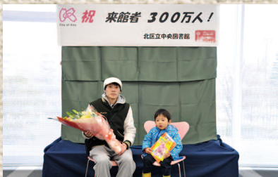
●中央図書館 来館者300万人達成(2月)