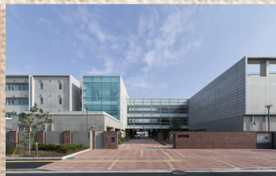
●十条富士見中学校 新校舎オープン(4月)