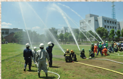
●中央公園で震災対策用消防井戸(深井戸)を使った震災対策訓練実施(7月)