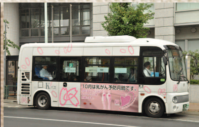
●北区ピンクリボンキャンペーン 10月は乳がん予防月間です(10月)