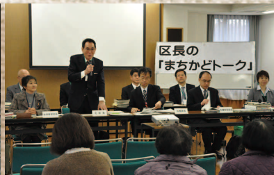
●区長の「まちかどトーク」(12月)