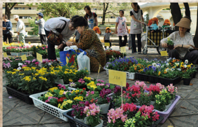
●第80回 区民植木市(10月)