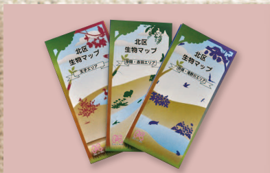
●北区 生物マップ発行(3月)