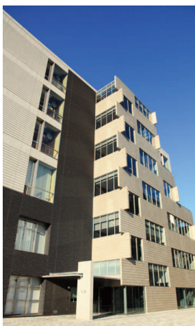
東洋大学総合スポーツセンター