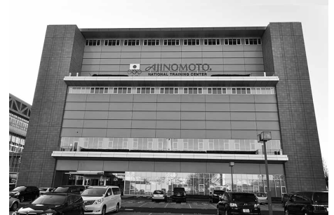
味の素ナショナルトレーニングセンター