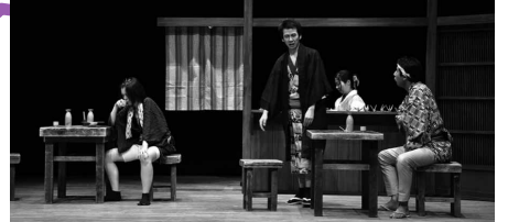
第9回大賞受賞作品「神隠し 異聞「王子路考」」