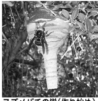
スズメバチの巣(作り始め)

寸胴な体型で、直線的に飛びます。巣は一輪さしの花瓶を逆さまにした形をしています。攻撃性が強いので、巣の撤去を個人で行うことは危険です。保健所では、個人のお宅にできたスズメバチの巣の撤去を支援しています。スズメバチの巣ができお困りの場合は保健所にご連絡ください。