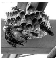
アシナガバチの巣

スマートな体型で、フワリと飛びます。スズメバチと比べて攻撃性が低く、巣を刺激したり、手で振り払ったりしなければ、刺されることはほとんどありません。巣はお椀を伏せた形で、六角形の巣穴がいくつもあります。