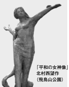
平和の女神像 北村西望作 (飛鳥山公園)

私たちは、わが国が非核三原則を堅持することを求めるとともに、心から世界の恒久平和と永遠の繁栄を願いつつ、ここに北区が平和都市であることを宣言します。 昭和61年3月15日 東京都北区