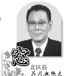
北区長 花川典悠太

【持ち物】映写機及び映写機材一式(前年度(最新)の検定書) 問 場 中央図書館図書係視聴覚担当(1条台1-2-5) ☎(5993)1125