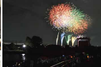
2013北区区民花火会(10月)