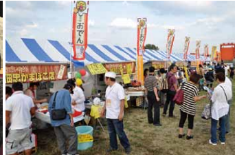
北区おでん事業月間(10月・11月)