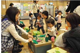
第16回遊びにおいてよい子育てフェスティバル(11月)