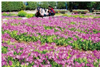
第49回浮間さくら草祭り(4月)