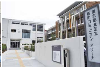
新町コミュニティアリーナオープン(7月)