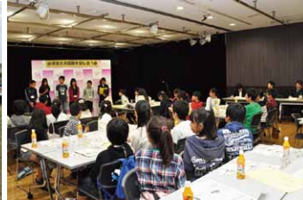
小学生と区政を話し合う会(10月)