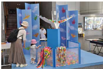
北区平和記念週間(8月)