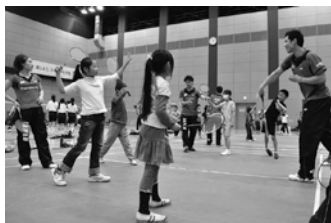
バドミントン教室