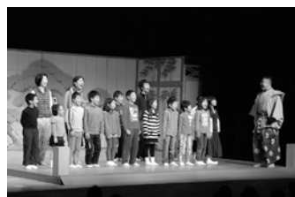
狂言の立ち方のレクチャーを受ける様子

対 区内在住、在学の小・中学生と家族 日 2月23日(日) 午後2時開演 場 北とびあつじホール 内 「仏師」[宝の櫃]の鑑賞(解説つき)と狂言体験 【出演】 善竹十郎(重要無形文化財総合指定保持者)ほか 定 400名(抽選) 申 往復はがき(記入例参照。全員(保護者は2名まで)の氏名、子どもの学年も記入)で、2月7日(金)(必着)まで ※1家族1通 問 電話 ☎114-8503(住所不要) 北区文化振興財団「親子で楽しむ狂言」N係 ☎ (5390)1222