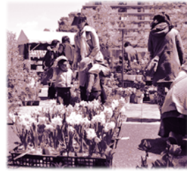
区民植木市の様子

催し・講座などを往復はがき・ファクス・Eメールなどで申込む場合の記入例は8面をご覧ください