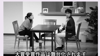
大賞受賞作品は舞台化されます 第10回大賞受賞作品「凶窟屋」

本賞の受賞者の中からはこれまでに多くのプロ作家が誕生しています。単なる自治体のイベントという枠を超えて、文芸の世界へ飛翔する、ささやかながら一つの登壇門として位置づけられたことを自負するものです。応募される方はその事実を踏まえて、想いを新たに、創作に取り組んでいただきたい。素晴らしい作品との出会いを楽しみにしています。