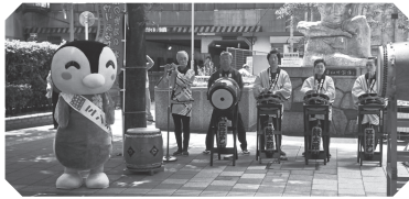
去年のイベントの様子

民生委員・児童委員には、民生委員法などにより守秘義務が課せられ、相談内容などを他人に話すことは禁じられています。安心してご相談ください。