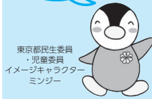
東京都民生委員・児童委員イメージキャラクター ミンジー