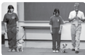
犬のしつけ方教室の様子