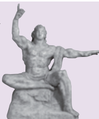
「平和祈念像」 北村西望作(北とびあ前)

私たちは、わが国が非核三原則を堅持することを求めるとともに、心から世界の恒久平和と永遠の繁栄を願いつつ、ここに北区が平和都市であることを宣言します。