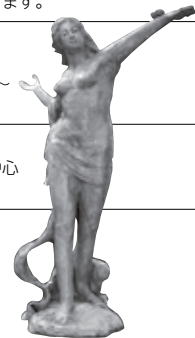
「平和の女神像」 北村西望作(飛鳥山公園)