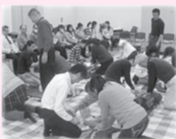
職員向け救命講習の様子