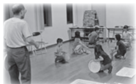
王子田楽の稽古の様子