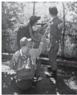
昨年度訓練の様子

日頃から自分自身が地震に備えるとともに、大地震からあなたを、あなたの家族を、あなたのまちを守るため、震災訓練に参加して防災行動力を高めましょう。