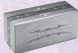
蒔絵珪瑠寶石箱「久遠」 浅井康宏