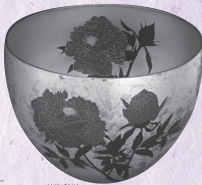
切嵌象嵌牡丹文鉢 奥山峰石