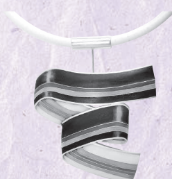
ペンダント「回廊」 小林輝子