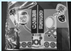
<区民まつり記念ミニはんでん> 1枚500円で当日販売(3会場共通)

●赤羽小学校 少年フットサル大会 5日(日) 午前9時～午後4時 ●赤羽駅東口駅前広場 赤羽人気店によるグルメ大会