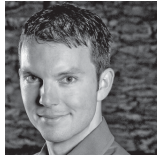
ケヴィン・スケルトン(テノール)