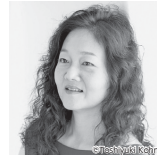
波多野睦美(メゾソプラノ)