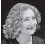
エマ・カークビー(ソプラノ)