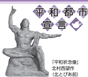
「平和祈念像」 北村西望作 (北とびあ前)

真の平和と安全を実現することは、私たちの願いであるとともに、人類共通の悲願であります。