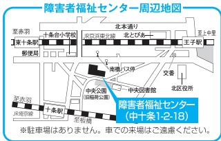
障害者福祉センター周辺地図