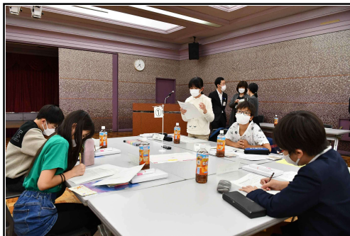
グループワークの様子（1班）