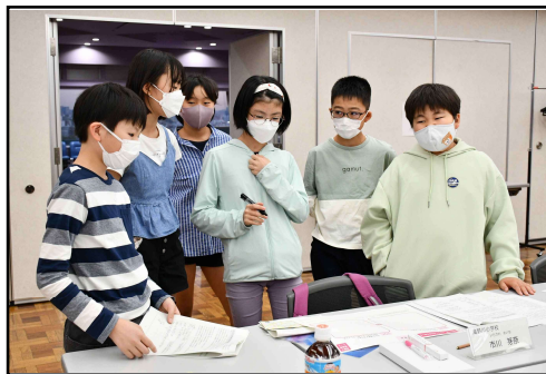
グループワークの様子（6班）