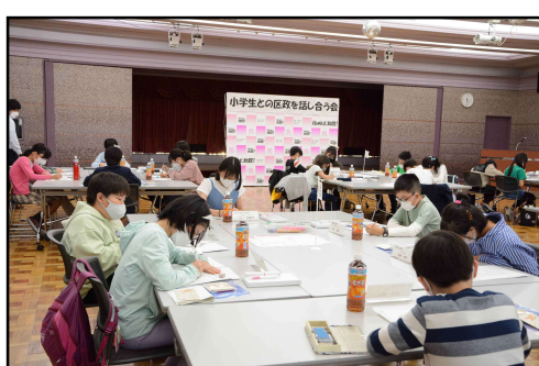
グループワークの様子（8班）