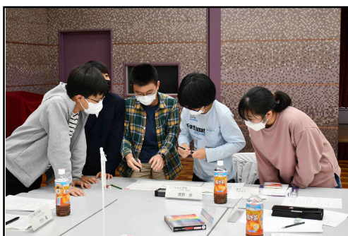
グループワークの様子（3班）