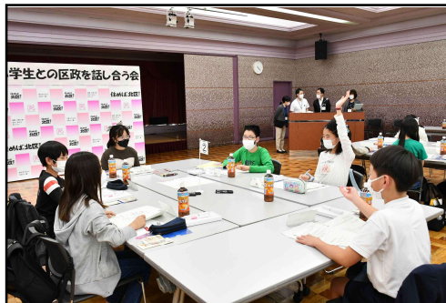
グループワークの様子（2班）