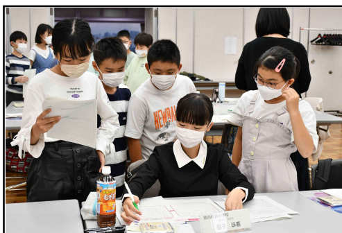
グループワークの様子（5班）