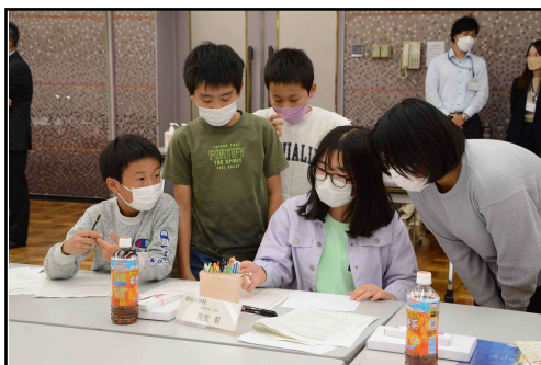
グループワークの様子（7班）