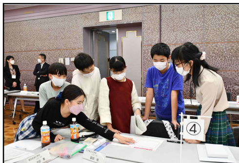
グループワークの様子（4班）