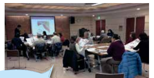
令和元年度は王子・赤羽・滝野川の3会場でマイ・タイムライン作成講座を行いました。

北区では、地域でのマイ・タイムラインの普及を目的として、令和元年度よりマイ・タイムライン普及リーダーを区民の皆さまから募集し、認定しています。また、認定した普及リーダーと共に区民の皆さまへマイ・タイムライン作成方法や水害の知識を教える「マイ・タイムライン作成講座」を行っています。