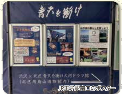
JRE王子駅南口のポスター