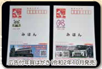
広告付年賀はがき(令和2年10月発売)

令和6年に新1万円札が発行されます。その時期に合わせ地域の発展・活性化に貢献できるものを新たに手掛けていきたいと思っています。