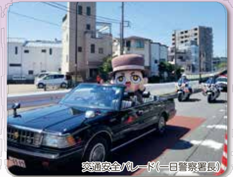
交通安全パレード(一日警察署長)