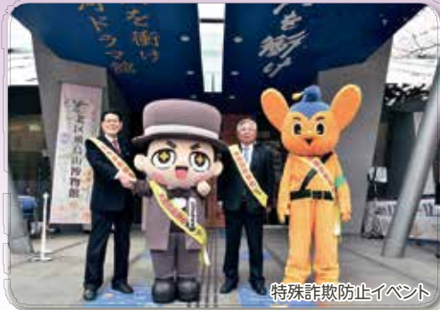
特殊詐欺防止イベント

これからも北区が安全・安心な街であり続けるために、北区と連携して、笑顔の輝くしぶさわくんと共に交通事故や特殊詐欺、各種犯罪被害を抑止すべく、各分野で積極的に活動をしていきますので、ご協力をお願いします。