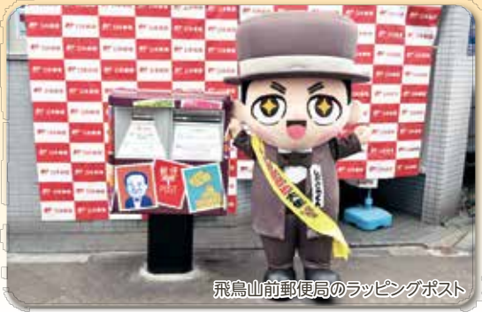
飛鳥山前郵便局のラッピングポスト