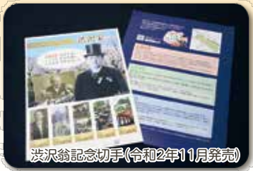
渋沢翁記念切手(令和2年11月発売)