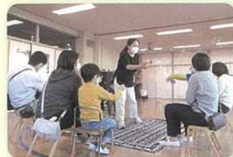
▲ 音楽ムーブメント