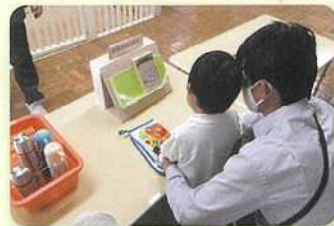
▲ 2歳児クラスの療育