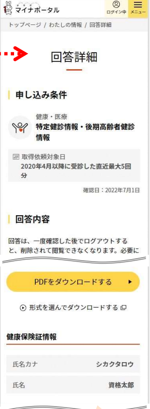
健康保険証情報を表示 PDFをダウンロード可能