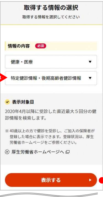
特定健診情報・後期 高齢者健診情報を選択