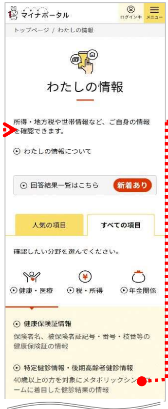
※令和2年度実施分以降の特定健診情報、 後期高齢者健診情報が対象