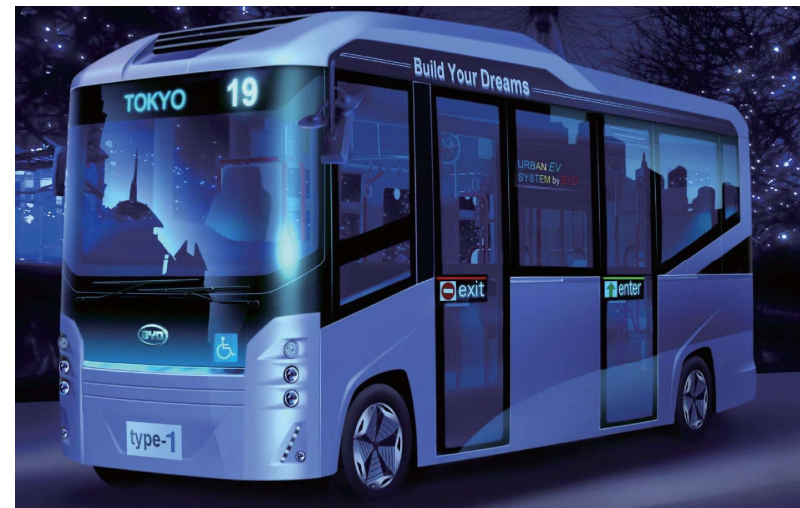
BYD J6小型バス イメージ図