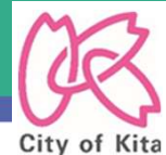
北区コミュニティバス（浮間地域）運行ルート図