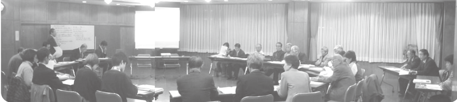
第11回志茂まちづくり協議会の開催状況

話し合いに提示された(仮称)志茂子ども交流館の整備案及び意見交換会の内容は以下のとおりです