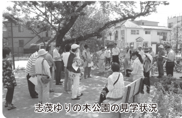
志茂ゆりの木公園の見学状況