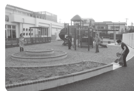
園内に子供がいないかチェックをして閉門