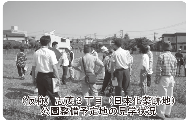
(仮称)志茂3丁目(日本化薬跡地)公園整備予定地の見学状況