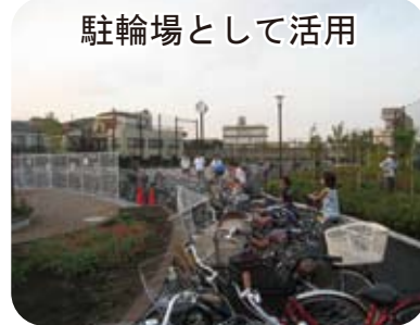
駐輪場として活用