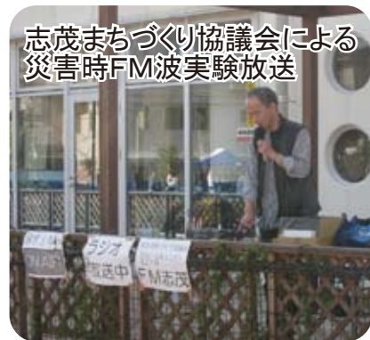
志茂まちづくり協議会による 災害時FM波実験放送