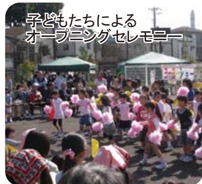
子どもたちによる オープニングセレモニー