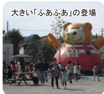
大きい「ふあふあ」の登場