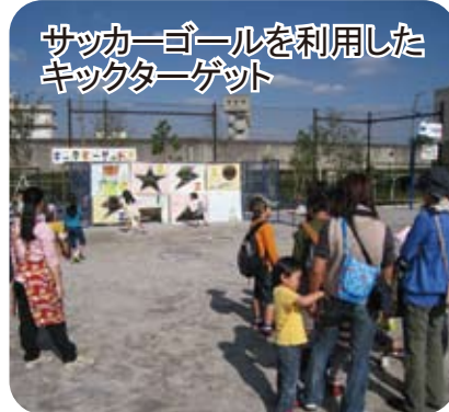
サッカーボールを利用した キックターゲット