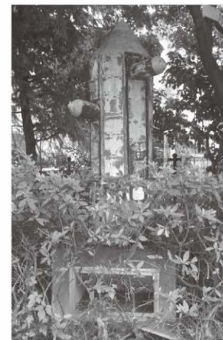
・校門付近のトーテムポール 下で発見