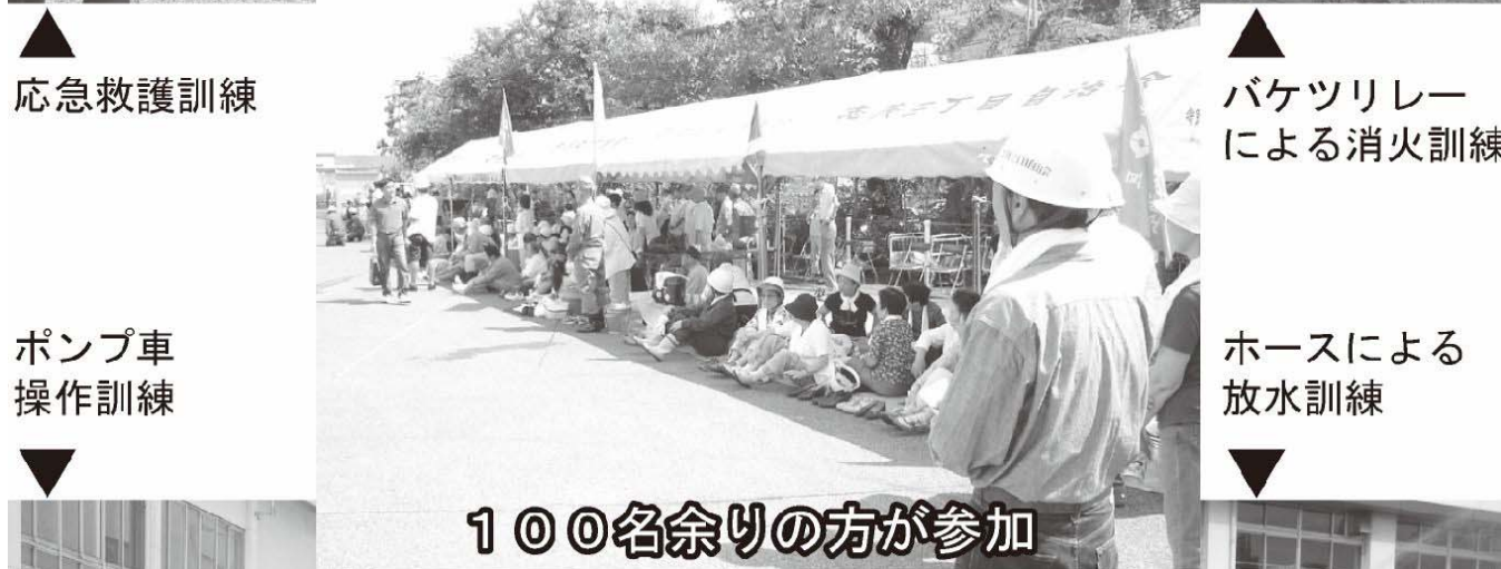
▼ ポンプ車操作訓練