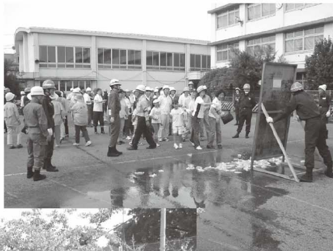
▲ バケツリレーによる消火訓練