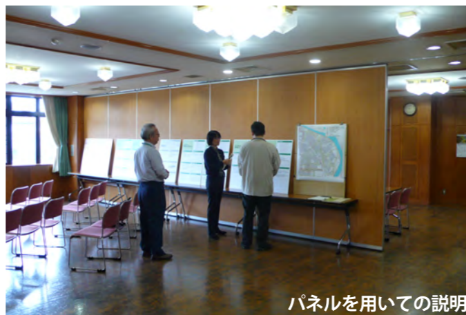
パネルを用いての説明