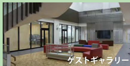
ゲストギャラリー