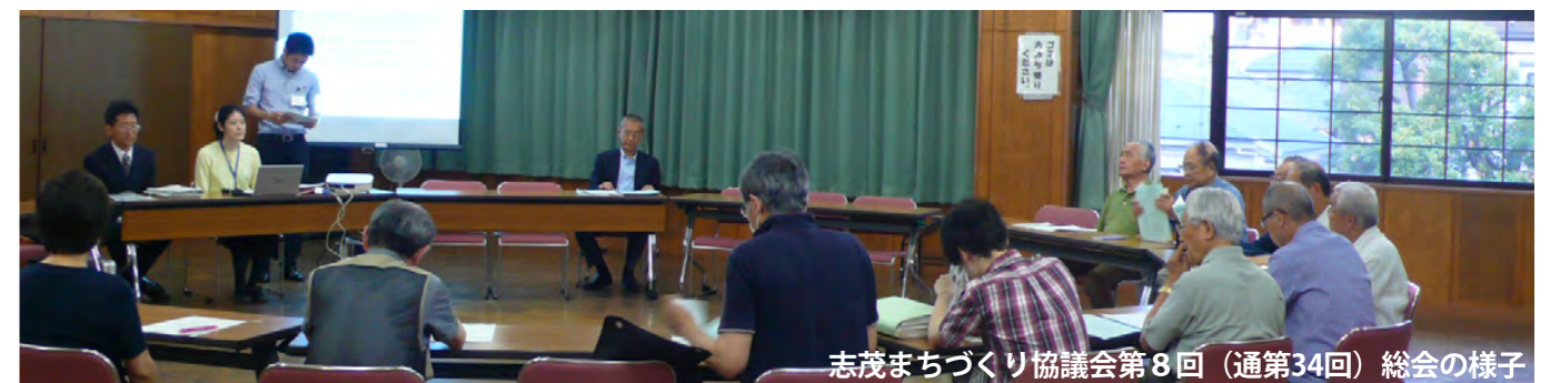
志茂まちづくり協議会第8回（通第34回）総会の様子

志茂まちづくり協議会は、志茂地区にお住まいの方々等、どなたでもご参加いただけます。志茂地区の防災まちづくりについてより詳しく知りたい方、また、ご意見のある方など、少しでも興味を持たれた方は是非ご参加ください。開催は不定期ですが、当ニュースでお知らせしていく予定です。参加にあたり、特にお申し込みなどは必要ありませんので、ご自由にご参加ください。多くの皆さまと一緒に、今後の志茂地区をよりよくするためのまちづくりを考えていきましょう。