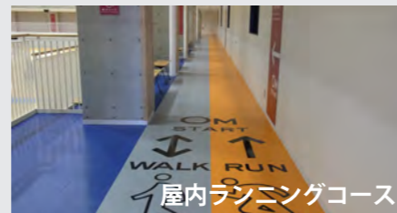
屋内ランニングコース