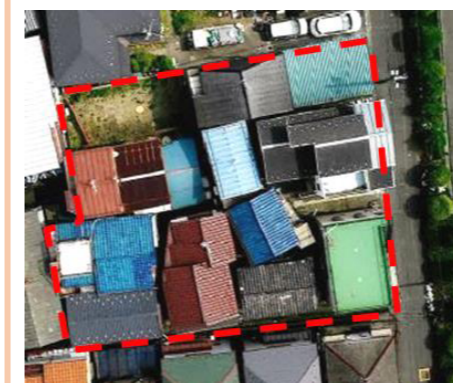
無接道の建物が多く、建て替えが進みませんでした。