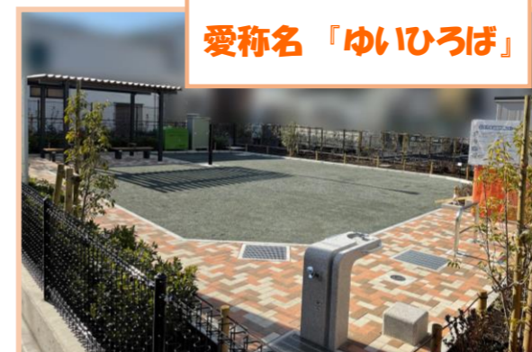
愛称名「ゆいひろば」

地域の方々との話し合う会で、「結(小さいお子さんからお年寄りまでを結ぶ)」をコンセプトとした児童遊園づくりを望む声が多かったことから、『ゆいひろば』の愛称名としました。