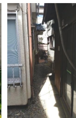
傘がさせないほど、狭い通路でした。