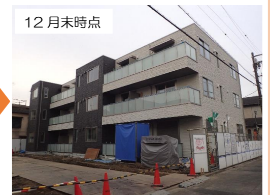
12 月末時点 防災性が高い建物に建て替えました。