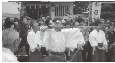
甘酒も振る舞われ