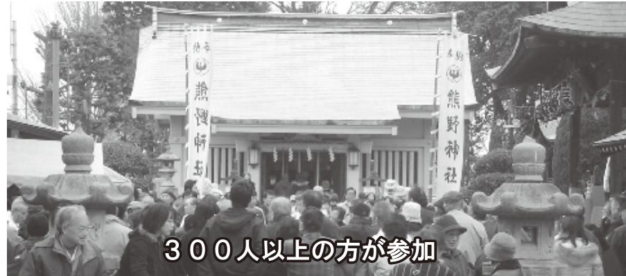
300人以上の方が参加