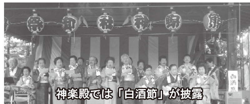
神楽殿では「白酒節」が披露