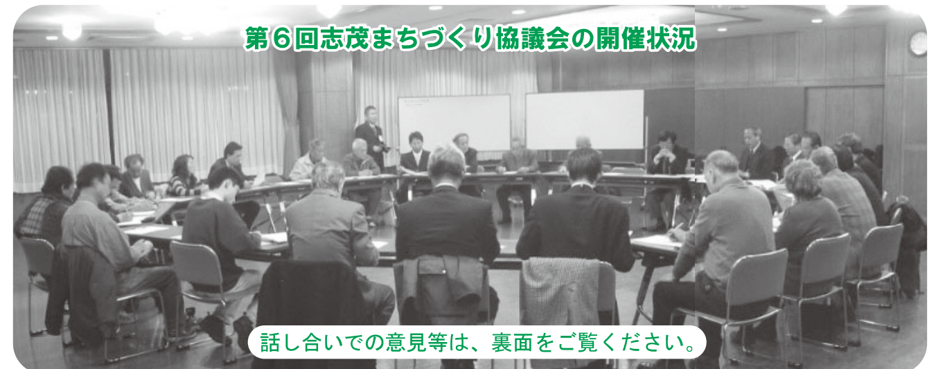
第6回志茂まちづくり協議会の開催状況