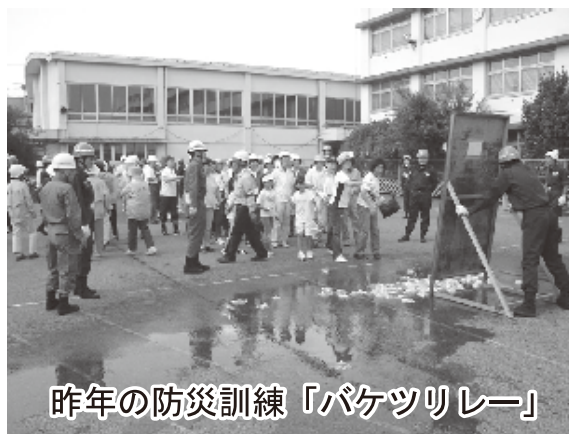
昨年の防災訓練「バケツリレー」

今年は9月2日(日)午前9時～11時45分に、旧志茂小学校グラウンドで開催します。