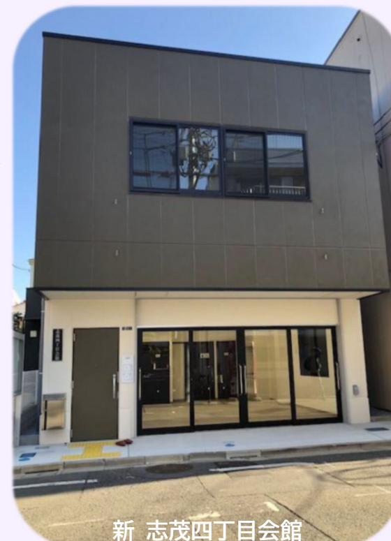
新 志茂四丁目会館

志茂四丁目会館は築60年が経過し、老朽化が著しく災害に対する脆弱性が懸念されていました。