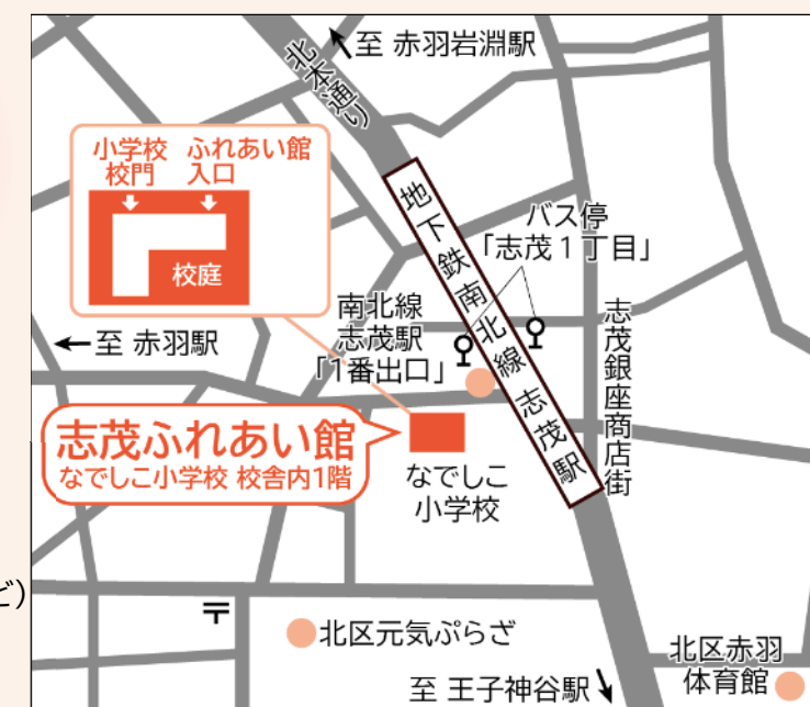
▲志茂ふれあい館 位置図