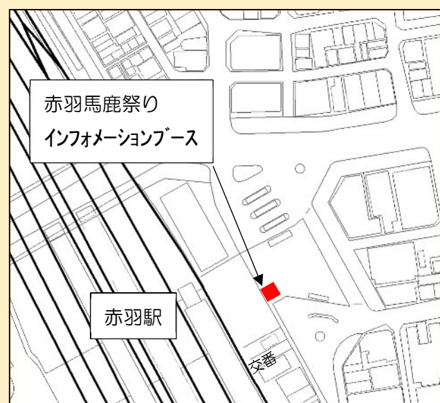
▼赤羽馬鹿祭りインフォメーションブース位置図