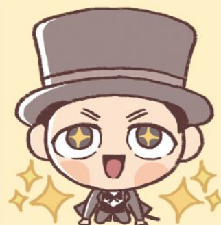
東京北区まちづくりプロジェクト 広報キャラクター しぶさわく