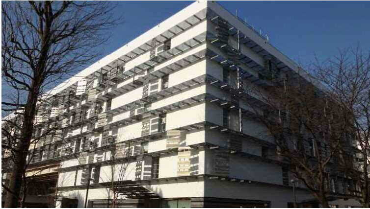
東洋大学 赤羽台キャンパス

平成29年3月19日に東洋大学赤羽台キャンパスの竣工式が行われました。当日は、学内でウェルカムフェスタも開催され、盛況のうち終了しました。