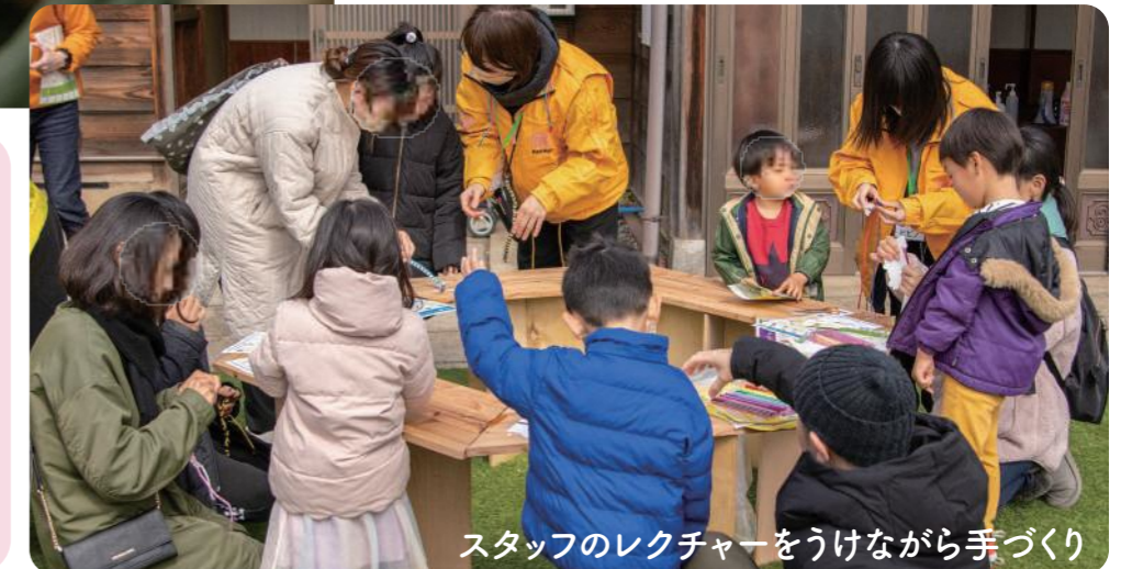
スタッフのレクチャーをうけながら手づくり