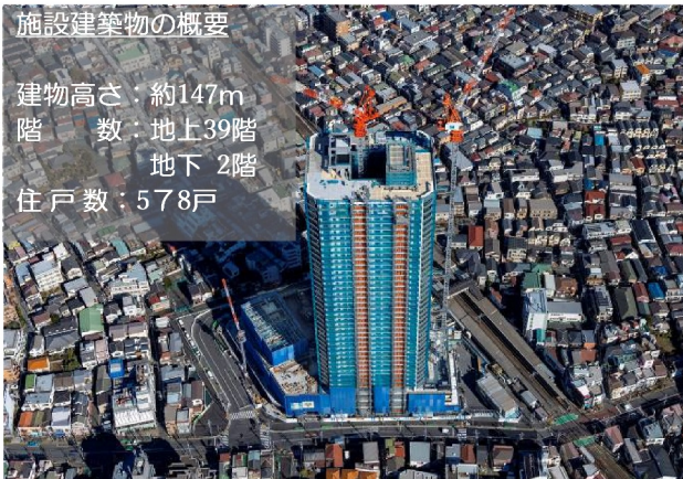
施設建築物の概要

令和6年1月末時点において、施設建築物（再開発ビル）の高層棟部分及び低層棟部分では、地上躯体工事及び内外装工事等を行っています。また、公共施設は、駅前広場の地下自転車駐車場の躯体工事等を行っています。