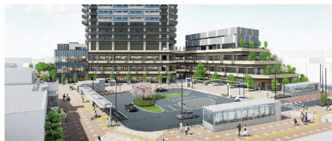
駅前広場イメージ