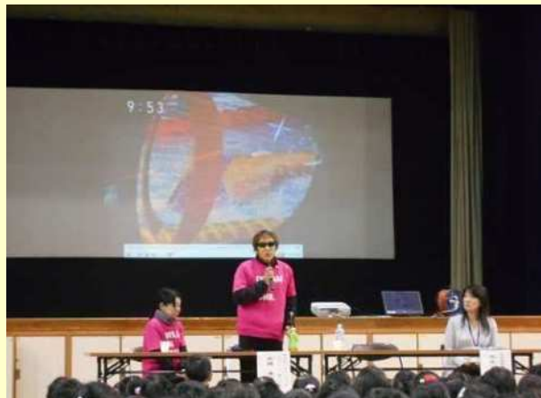
アテネパラリンピック 金メダリスト 高橋 勇市 氏による講演（令和元年12月）