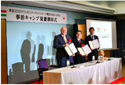
覚書調印後の様子