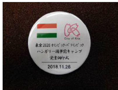
記念缶バッジ（列席者配布）