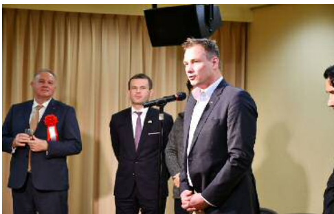
ハンガリーオリンピック委員会 クルチャール会長のご挨拶