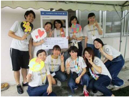
平成 30 年度メンバー

メンバーは東京家政大学及び東洋大学の学生で構成しており、平成 30 (2018) 年度は 10 名で活動している。このプロジェクトチームの活動期間は、2021 年 3 月末までとなっている。