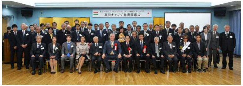
列席者全員での記念撮影