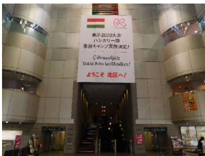
北とぴあ1階区民プラザ