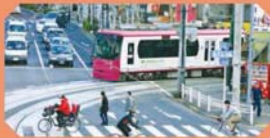
飛鳥山公園歩道橋

都電が一般道を走る珍しいスポット。歩道橋から見下ろせば、車と一緒に走る都電の姿が。春には飛鳥山の満開の桜をバックに走る姿も。