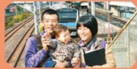
王子駅 南口 踏切橋

踏切橋の階段を上ると、JRのホームが近くに。その上には新幹線。踏切橋の下には宇都宮線・高崎線が走り抜けます。電車の臨場感満点のスポット。