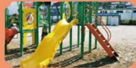
栄町ふれあい公園

園内には車両をかたどったトイレや、都電のレールを模した舗装など、電車好きにうれしいモチーフも。