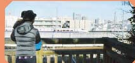
さくら亭橋の展望デッキ

誰でも利用できるテーブルとベンチで、ランチしながら新幹線を眺められるので、お目当ての新幹線をのんびり待つならココ。散策の際の休憩にも。