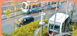
飛鳥山公園北側(アスカルゴ山頂駅)

アスカルゴに乗りながら、大きな窓から脇の車道を走る都電やJR王子駅のホームを眺められます。電車を見る角度が変化していくのも面白いです。