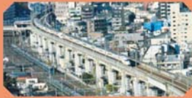
北とびあ 17 階

いろいろな新幹線や在来線が王子の街並みを走り抜けていく様子はいつまで見ても飽きません。5階の屋上庭園も目の前を新幹線が通ります。